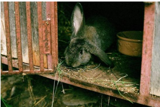
zaslala Terezka Š., 7.A