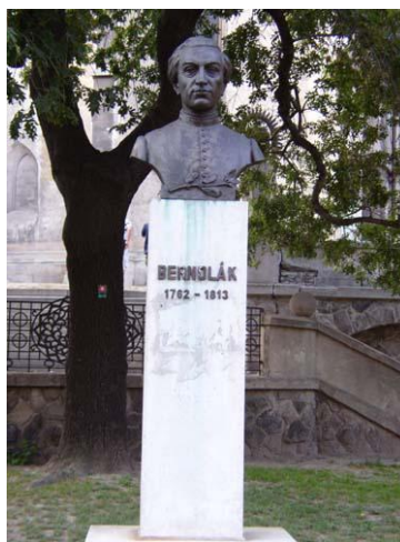
Socha A. Bernoláka, Rudnayovo námestie