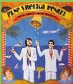
Plné vrecká peňazí

Od roku 1978 bol docentom televíznej a filmovej dramaturgie na VŠMU. V roku 1972 mu udelili národnú cenu SSR, v roku 1977 štátnu cenu Klementa Gottwalda a v roku 1975 mu bol udelený titul zaslúžilý umelec. V roku 2010 sa stal čestným členom Spoločnosti M. R. Štefánika. V súčasnosti je na dôchodku a žije v Bratislave.